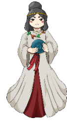
マスコットキャラクター いぎなみ